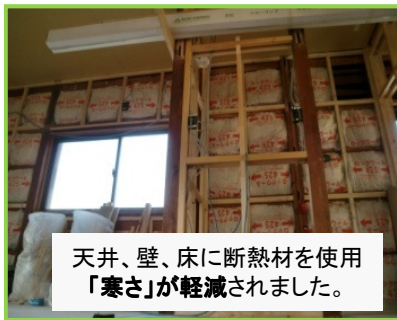
天井、壁、床に断熱材を使用 「寒さ」が軽減されました。